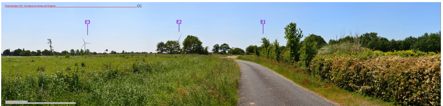
Photomontage depuis l'Orgerais

Les prises de vue sont assemblées côte à côte pour former un panorama